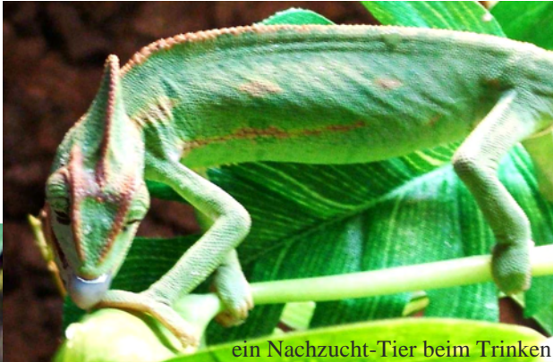
ein Nachzucht-Tier beim Trinken

Bei einer Unterbringung im Außenterrarium habe ich festgestellt, dass die Chamäleons bei Regen nicht panikartig ins Trockene flüchten wie bei dem feinen Sprühnebel der Beregnungsanlage.