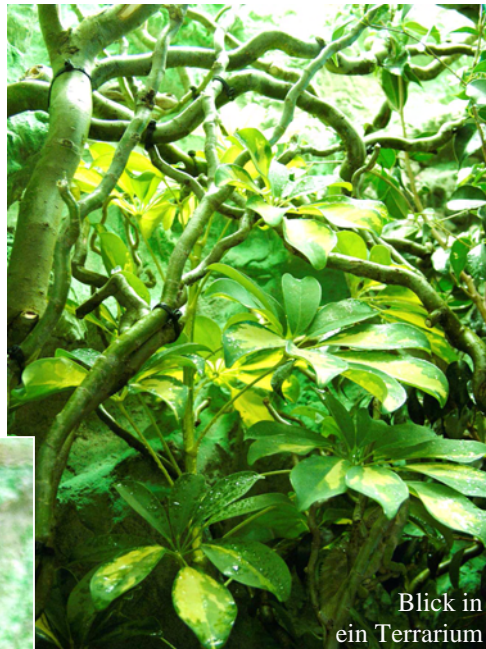
Blick in ein Terrarium

bis auf 10°C ab, ein Wärmespot wird vormittags für 2 Stunden pro Tag zugeschaltet und die gesamte Beleuchtungszeit auf 10 Stunden reduziert. Für den Stoffwechsel und auch für eine erfolgreiche Verpaarung ist das Einhalten der Winterphase, die im November mit dem schrittweise Reduzieren der Beleuchtungsdauer beginnt und im Februar mit dem Erhöhen der Beleuchtungsdauer langsam aufhört, zu empfehlen. In der Winterphase wird das Futter reduziert und die Feuchtigkeit leicht erhöht.